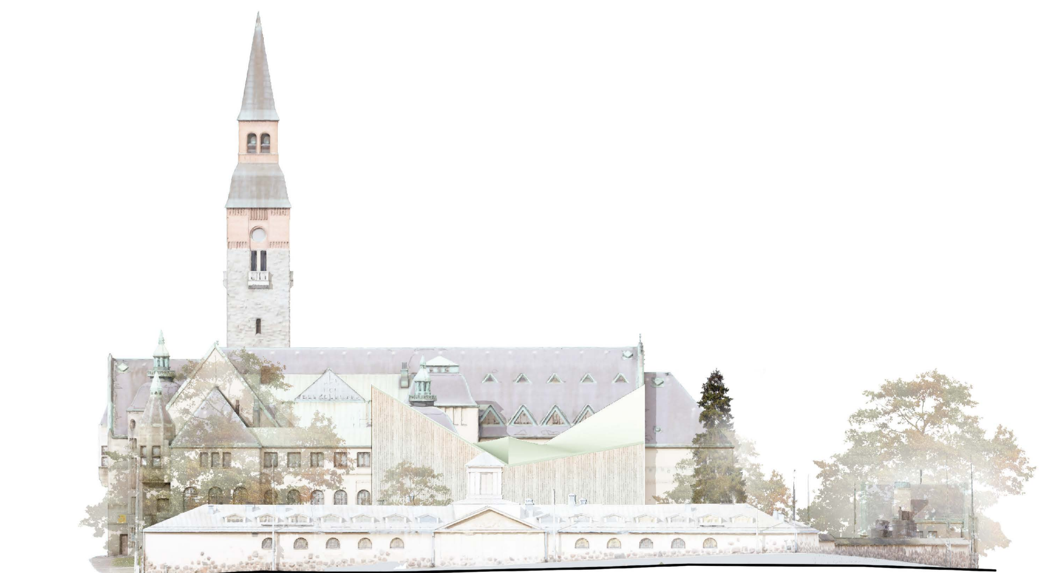
Julkisivupiirustus pohjoiseen 1:400