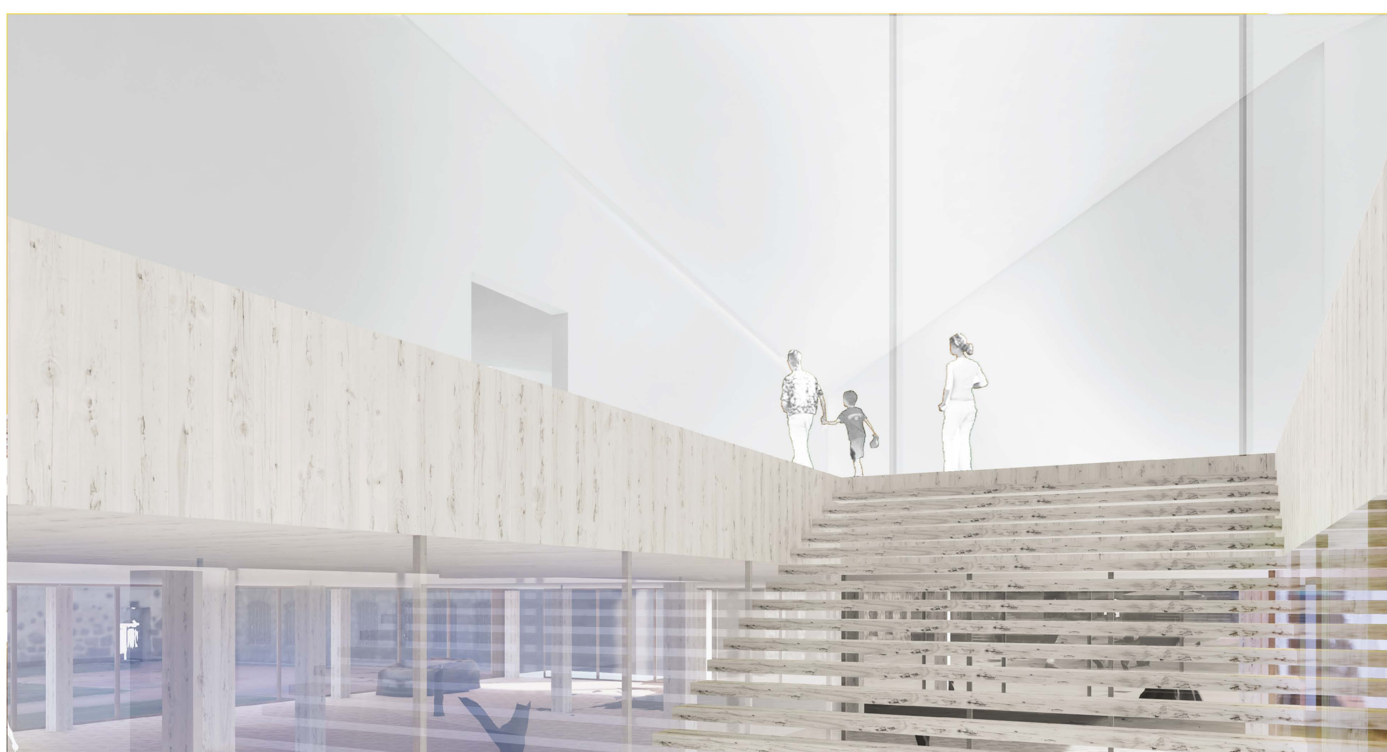
Näkymäkuva aulaportaalta näyttelytilaan