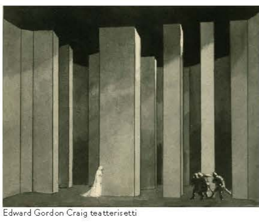
Edward Gordon Craig - teatterisali