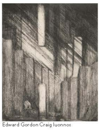
Edward Gordon Craig - luonnos