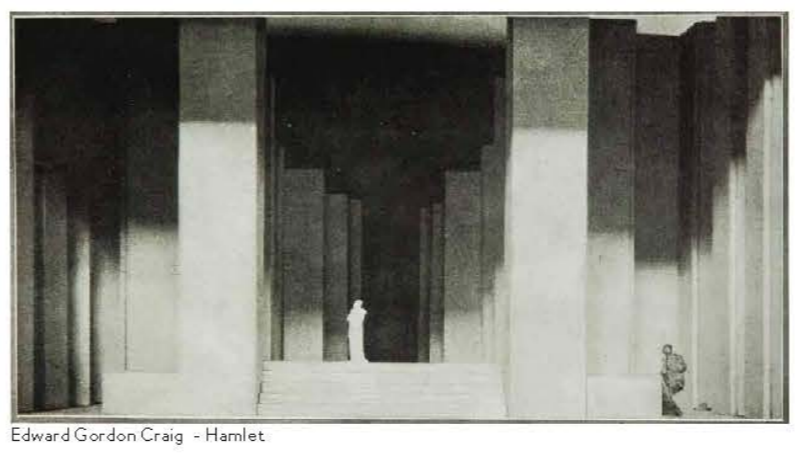
Edward Gordon Craig - Hamlet