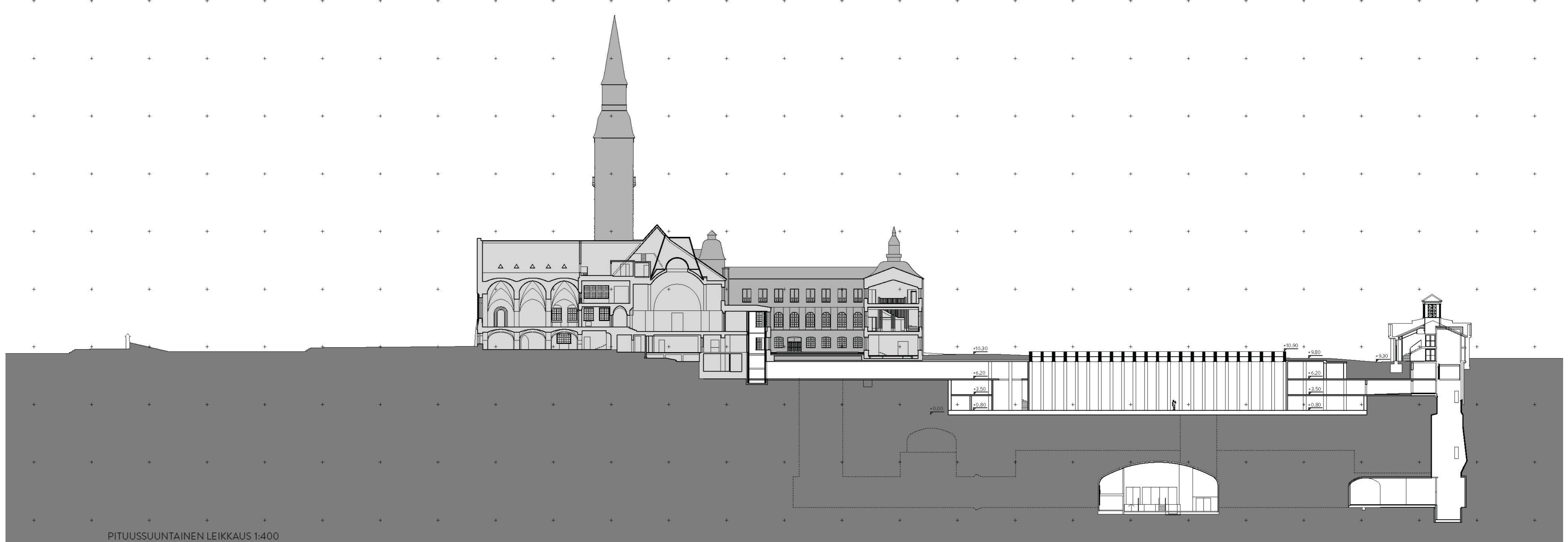
PITUUSSUUNTAINEN LEIKKAUS 1:400

ASEMAPIIRROS 1:400 MANNERHEIMINTIE MUSEOKATU TÖÖLÖNKATU